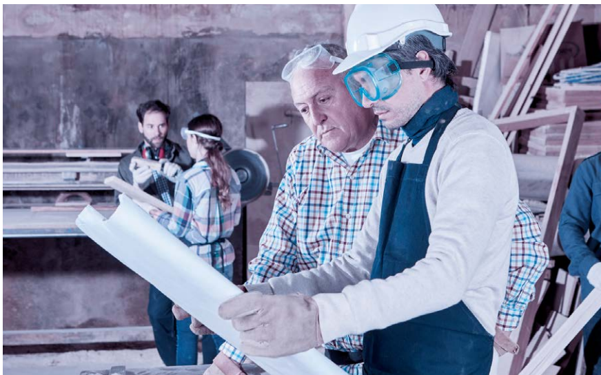
Auch wenn dem Patron etwas zustösst, soll die Firma weiterlaufen.

Wenn die Eheleute keinen ausserordentlichen Güterstand im Rahmen eines Ehevertrags vereinbart haben, gelten die gesetzlichen Bestimmungen der Errungenschaftsbeteiligung. Während jeder Ehegatte sein Eigengut behalten kann – Vermögen, das in die Ehe mitgebracht wurde sowie Erbschaften und Schenkungen –, ist die Errungenschaft, das während der Ehe erworbene Vermögen, hälftig zu teilen. Stellt das Unternehmen Errungenschaft dar, steht dem Ehepartner des Unternehmers grundsätzlich die Hälfte des Nettowerts des Unternehmens zu, insbesondere dann, wenn er während der Ehe dauernd nicht berufstätig war. Hohe Ersatzforderungen können auch entstehen, wenn der Unternehmer aus den laufenden Einnahmen oder aber der Nichtunternehmer aus seinem Eigengut in das Unternehmen investiert hat. Zum Schutz des Unternehmens können Vermögenswerte, die das Unternehmen verkörpern, zu Eigengut erklärt werden.