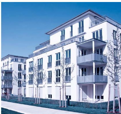
Steigt mit einer Umzonung die Ausnützungsziffer, entsteht ein Mehrwert.

Es ist den Kantonen in einem bestimmten Rahmen überlassen, wie sie die Mehrwertabgabe ausgestalten. Das läuft nicht überall reibungslos. Die Regelungen von Luzern und Schwyz genügen den Mindestanforderungen des Bundes noch nicht. Sie müssen nachbessern und un-