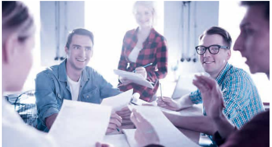
Aktionärbindungsvertrag: ein sinnvolles Instrument, um in guten Zeiten vorausschauende Regelungen für schwierige Phasen zu definieren.

Fast alle Aktionärbindungsverträge sehen Veräusserungsbeschränkungen vor, gerade in Familienbetrieben und Aktiengesellschaften mit wenigen Aktionären. Beispielsweise erwirbt man mit einem Kaufrecht das Recht, Aktien zu erwerben, ohne dass die Zustimmung der anderen Partei erforderlich wäre. Das kann sinnvoll sein, wenn ein Unternehmensaktionär bei der Gründung nicht das ganze Aktienkapital aufbringen kann, aber später den Anlegeraktionär auskaufen will. Vorhandrechte wiederum verpflichten dazu, seine Aktien der anderen Partei anzubieten, bevor ein Vertrag mit einem Dritten abgeschlossen wird. Ein Vorkaufsrecht berechtigt dazu, anstelle eines Dritten zu den Konditionen,