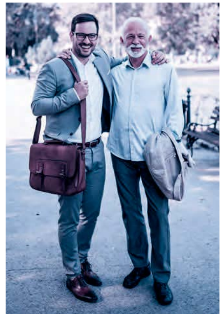
Finanzierung nach dem Umlageverfahren: zuerst einzahlen, später beziehen.