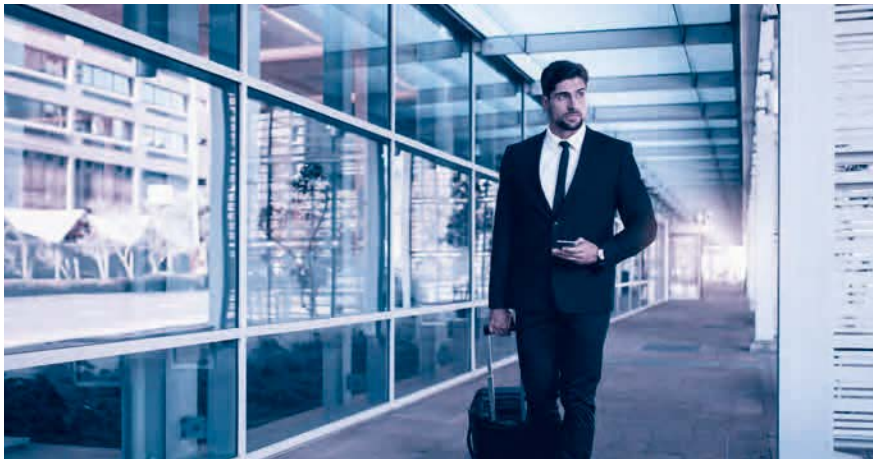
A1-Bescheinigung dabei? Sie ist für alle Aktivitäten im Ausland nötig.

entrichten hat. Es ist für sämtliche grenzüberschreitenden Tätigkeiten nötig, beispielsweise für Berater, Künstler, Journalisten oder Mitarbeiter im Transport oder Baugewerbe, und zwar auch dann, wenn der Aufenthalt nur wenige Stunden beträgt. Ausgestellt wird die A1-Bescheinigung von der AHV-Ausgleichskasse im Wohnsitzland des betroffenen Arbeitnehmers, beantragt wird sie vom Arbeitgeber des Entsandten bzw. direkt vom Selbständigerwerbenden.